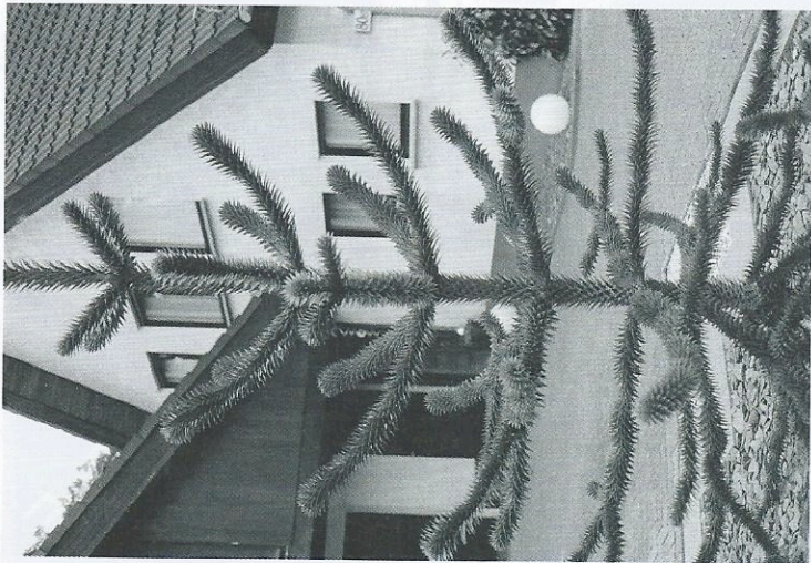
Siegerarbeiten „gute aussichten 2014/2015“: Bild links: Katharina Fricke