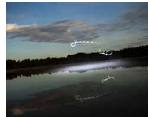
JEWGENI ROPPEL: Svetloyar, 2014/2015