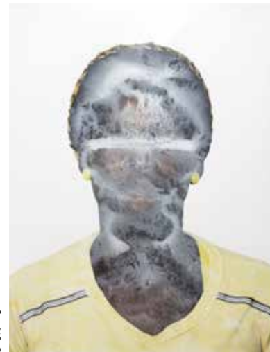
NICOLAI RAPP: Chicks, Rags, Hopes, 2014–2016