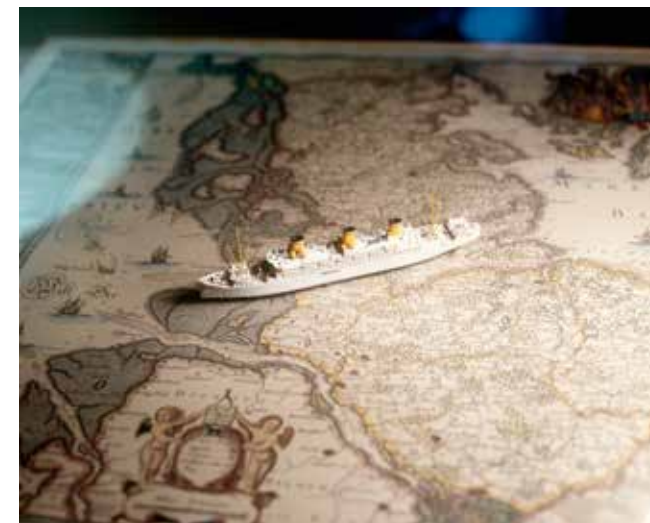
JULIAN SLAGMAN: Vergissmeinnicht, 2015–2017, © Julian Slagman