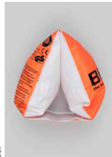
CLAUDIA CHRISTOFFEL: FUN-GBH-EAT, 2016 © Claudia Christoffel