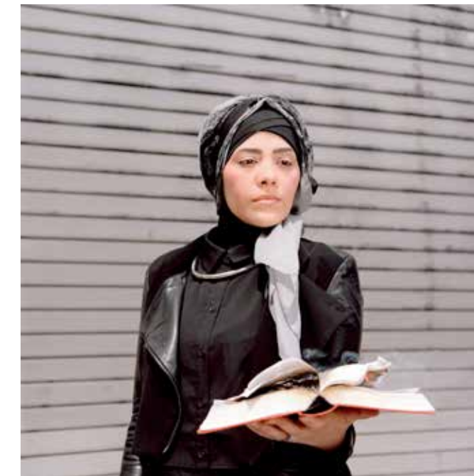
ALEXANDRA POLINA: Masks, Myths and Subjects, 2017, © Alexandra Polina