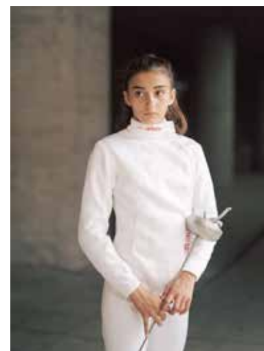
MONIKA CZOSNOWSKA: Eliten, 2017 © Monika Czosnowska