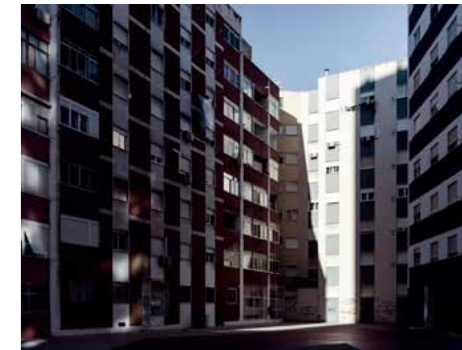
RICARDO NUNES: Places of Disquiet, 2016/17