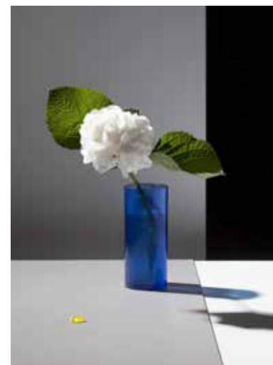
FELIX DOBBERT: Some Flowers, 2014 © Felix Dobbert