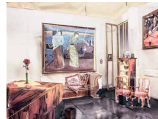
GEORG BRÜCKMANN: Kundmannsgasse 19, 2015–2017