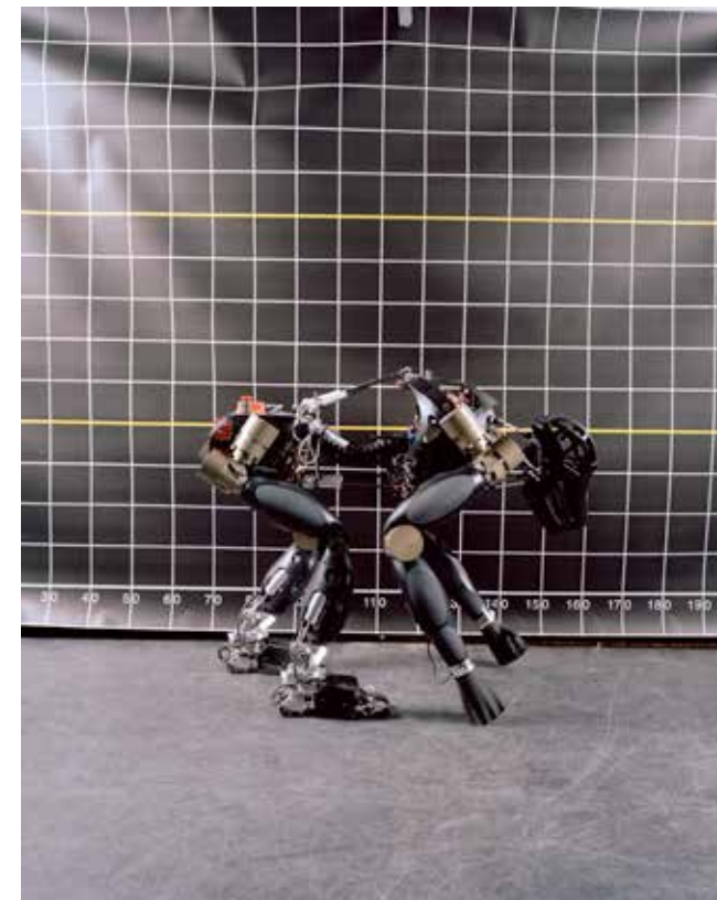
JANOSCH BOERCKEL: Nonplusultra, 2015–2017, © Janosch Boerckel