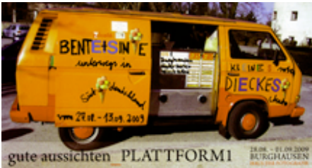
Einladungskarte zur "gute aussichten_plattform1", wie wir sehen, individuell umgestaltet von Sinje und ...

Adresse: Cityhaus I, Friedrich-Ebert-Anlage, Platz der Republik, D-60325 Frankfurt/M. Telefon +49 (0)69-7447-2386, www.dzbank.de . Öffnungszeiten: Dienstag bis Samstag 11-19 Uhr. Öffentliche Verkehrsmittel: Alle S- und U-Bahnen mit der Haltestelle Hauptbahnhof, Straßenbahnen 11, 16, 17, 20, 21, Bus 32 mit der Haltestelle Platz der Republik, öffentliches Parkhaus: Westend.