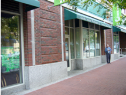
... und ab Mitte Juni 2010, in Auszügen, im Goethe-Institut Washington DC

Adresse: Calle Zurbarán 21, E-28010 Madrid, Telefon 0034-91-3913-944, www.goethe.de/madrid . Öffnungszeiten: Montag bis Freitag 9-19 Uhr.>br>Eine repräsentative Auswahl der "gute aussichten 2009/2010" Arbeiten sind der offizielle deutsche Beitrag des Goethe-Instituts Madrid zu dem Fotografie Festival "Photo Espana".