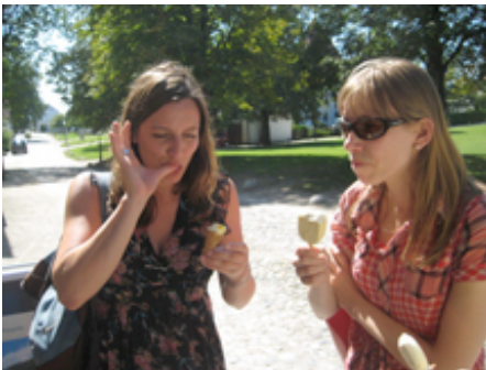
... beim Wort genommen: Eis schlecken im Sommer in Burghausen!

Bereits zum fünften Mal in der amerikanischen Hauptstadt zu Gast präsentiert "gute aussichten" dieses Jahr eine schöne Auswahl der Werke der acht Preisträger(innen) des aktuellen Jahrgangs 2009/2010.